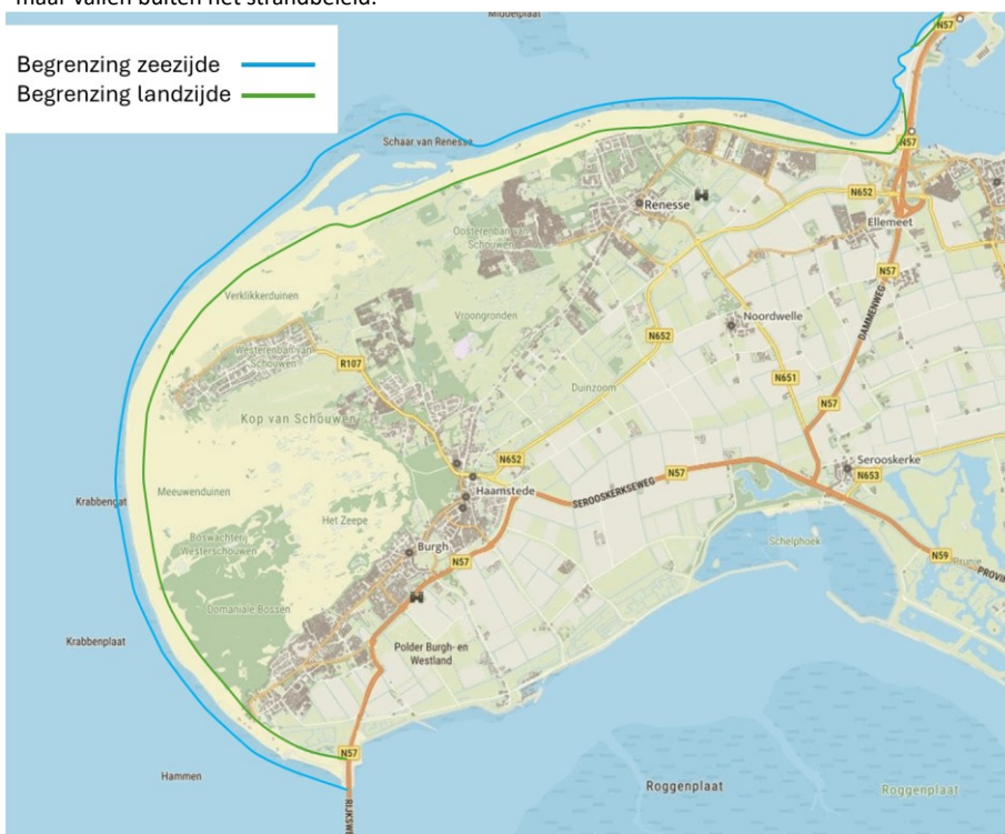
Figuur 1: Begrenzing reikwijdte strandbeleid

Binnen het werkingsgebied van het strandbeleid heeft dit beleid betrekking op het strand tussen de laagwaterlijn en de duinvoet aan de landzijde. Dit betekent dat de stranden en de eerste duinenrij inclusief daarin aanwezige paden (inclusief en na de slagboom) onderdeel uitmaken van het beleid. De uitgestrekte duingebieden die overlopen in het bos van de Boswachterij Westenschouwen en de duingebieden in Natura 2000 gebied Kop van Schouwen vallen hier niet onder. Parkeerplaatsen en voorzieningen buiten het werkingsgebied hebben uiteraard een nauwe relatie met het strandbeleid, maar vallen buiten het strandbeleid.